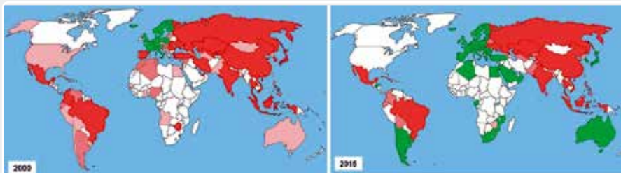
Slika 2. Uporaba i zabrana azbesta na svjetskoj razini (usporedba godina 2000. i 2015.)

Legenda: bijelo <500 tona, ružičasta 500 – 2000 tona, tamno ružičasta 2000 - 10 000 tona, crveno >10 000 tona, zeleno - zabrana uporabe.