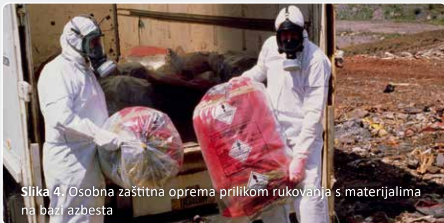
Slika 4. Osobna zaštitna oprema prilikom rukovanja s materijalima na bazi azbesta