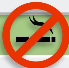
Slika 6. Znakovi upozorenja i sigurnosti

Pušenje značajno podiže razinu rizika u slučaju izloženosti azbestu!