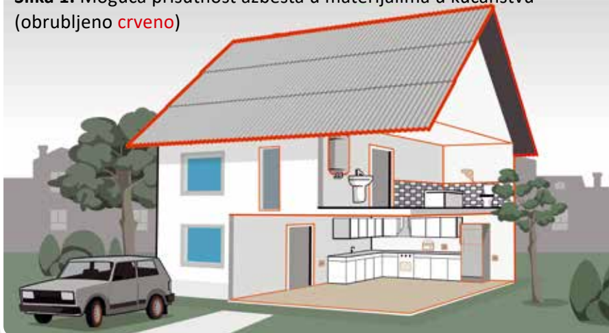
Slika 1. Moguća prisutnost azbesta u materijalima u kućanstvu (obrubljeno crveno )

Izloženost azbestu se javlja SAMO u slučaju oštećenja materijala, objekta ili predmeta koji sadrže azbest!