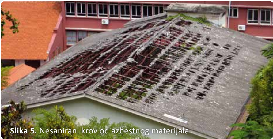
Slika 5. Nesanirani krov od azbestnog materijala