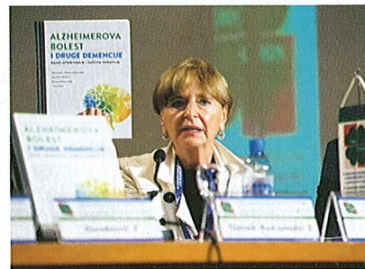
Na skupu je premijerno predstavljen sveučilišni udžbenik „Alzheimerova bolest i druge demencije – rano otkrivanje i zaštita zdravlja“